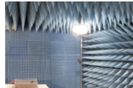
EMV-Labor EMC Laboratory