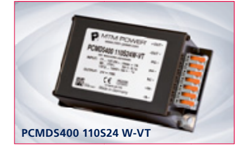
PCMDS400 110S24 W-VT